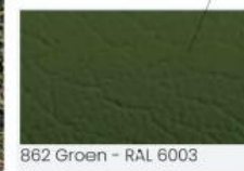
862 Groen - RAL 6003